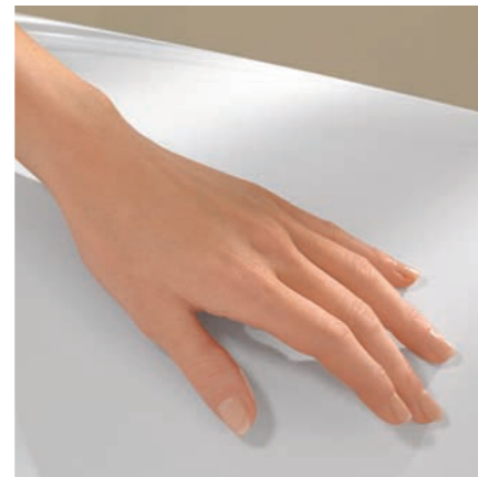
Glatte, porenfreie Oberfläche

Gleichzeitig sind Quaryl®-Wannen rutschhemmend. Das gibt ein gutes und sicheres Gefühl.