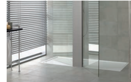
Duschwanne Squaro Superflat