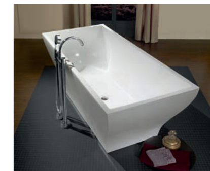
Badewanne La Belle