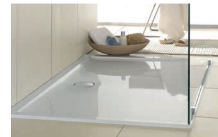
Duschwanne Futurion Flat