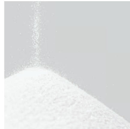
Die Basis: 60 % reines, fein gemahlene Quarzmehl