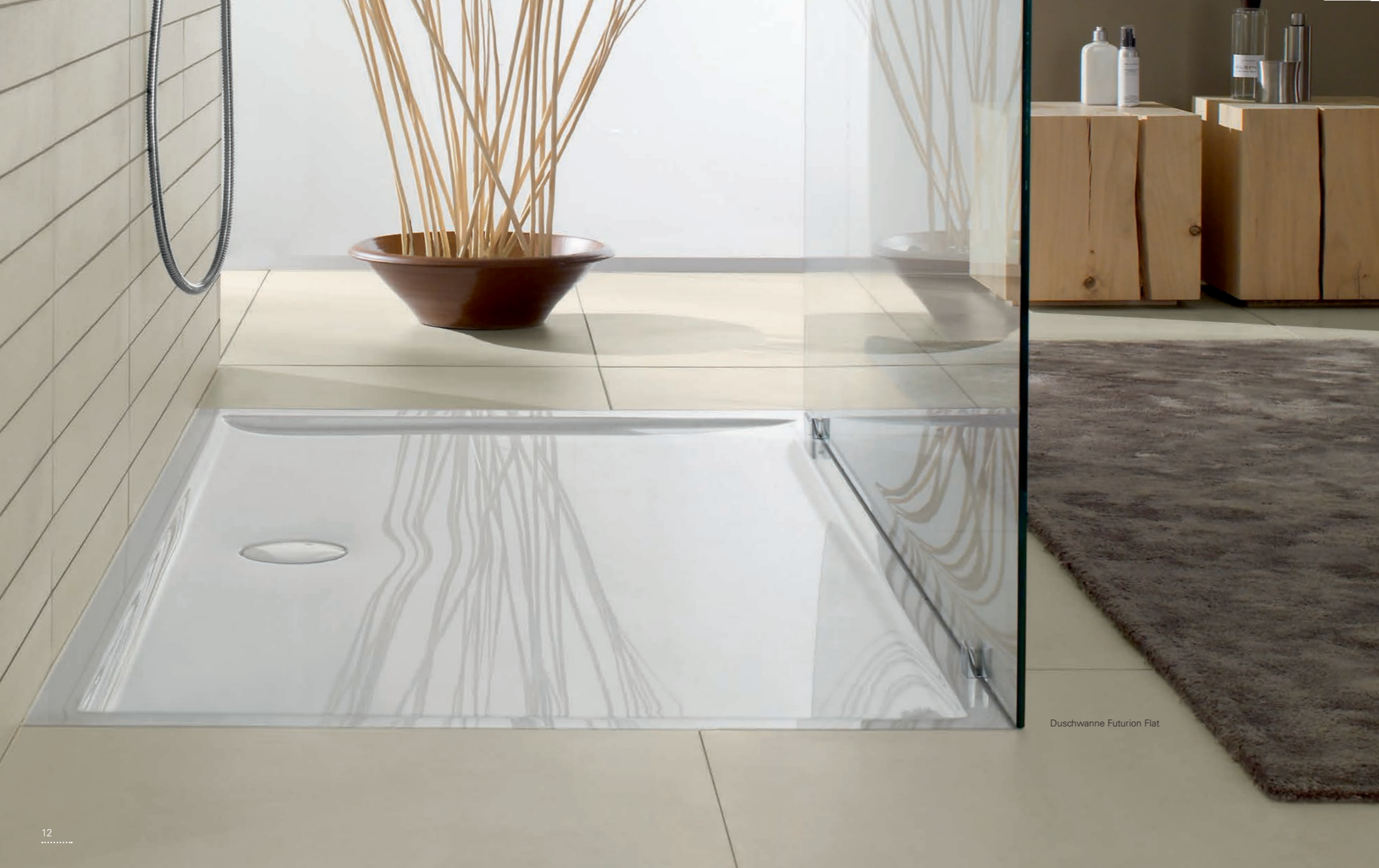
Duschwanne Futurion Flat