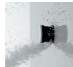
Invisible Jets Pop-up Seitendüsen